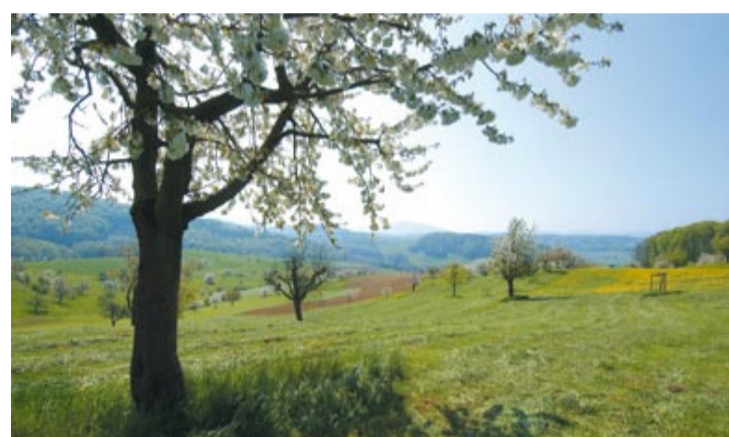
Urbane Landschaft in urbanem Kontext #1

Max Hollein, Direktor der Schirn und des Städel Museums in Frankfurt, plädiert für die bürgerliche Initiative und Kulturförderung.